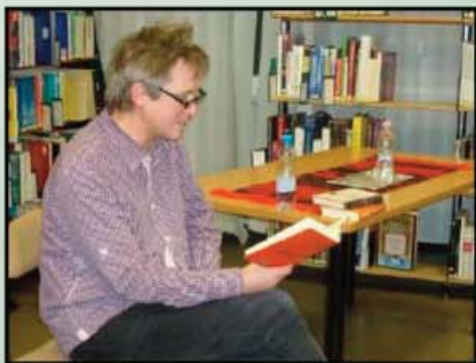
Háy János felolvas saját művéből, majd dedikál.

Minden alkotó embernek a megélt és a tanult élményei adják az alkotás alapját. Háy János írásaiban sokszor visszaköszönnek a gyermekkori élmények, karakterek, de sosem szolgálisan átvett formában. Az élmény egy morzsája felismerhető, egy-egy történés, tény, ám amint megszületik egy írás, már egészen más összefüggésekben szerepel az adott esemény: a realitástól elvonatkoztatva, más megvilágításban, más arányokban éled újra. Fontos, hogy az alkotó bizonyos távolságtartással kezelje az élményeit, szinte eltávolítva magától, mintegy felülről szemlélve a tényeket. Ilyen módon uralva az eseményt tud olyan általános érvényű gondolatokat átadni, amelyek az olvasók számára a ráismerés, az érintettség pillanatát okozzák.